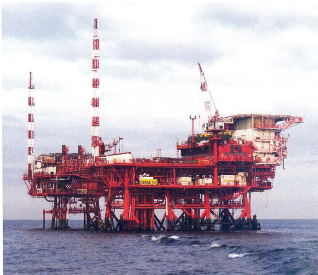
Piattaforme “Garibaldi C” e “Garibaldi K”

Analisi del gas naturale nella piattaforma di compressione gas “Garibaldi K” della società ENI S.p.A. Divisione Exploration & Production, ubicata nel off-shore Adriatico.