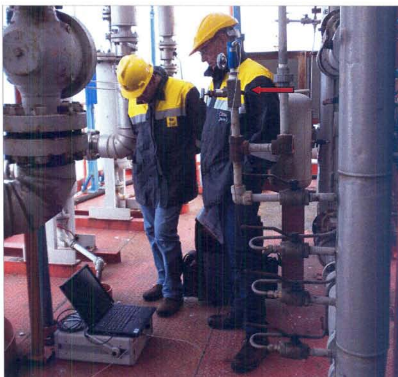
Foto 1 – Punto di campionamento (freccia di colore rosso) e gascromatografo portatile \mu GC 3000 Agilent

L'analisi composizionale del gas è stata condotta dai tecnici della Divisione V con l'ausilio di un gascromatografo portatile modello \mu GC 3000 della ditta Agilent.